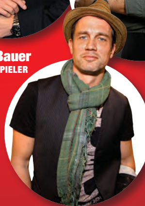
Ralf Bauer SCHAUSPIELER